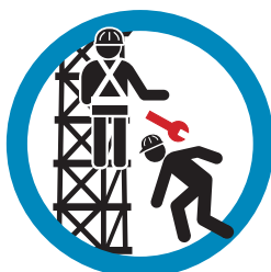
BIJ WERKZAAMHEDEN OP HOOGTE MATERIAAL/MATERIEEL GOED ZEKEREN