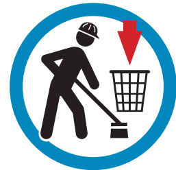
ZORG VOOR EEN OPGERUIMDE WERKPLEK