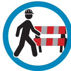
ZORG VOOR VEILIGE AFZETTING BIJ DE WERKPLEK