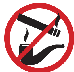
NIET ROKEN BUITEN DE DAARVOOR BESTEMDE GEBIEDEN