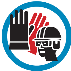
GEbruik DE VOORGESCHREVEN PERSOONLIJKE BESCHERMINGSMIDDELEN (PBM'S)