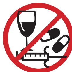
NIET WERKEN OF RIJDEN ONDER INVLOED VAN ALCOHOL EN/OF DRUGS