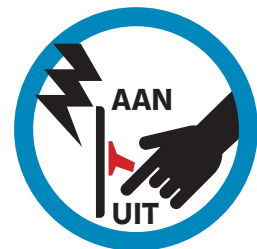
ZORG DAT DE APPARATUUR IN DE OMGEVING IN DE JUISTE OPERATIONELE STAND STAAT