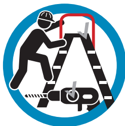
GEbruik DE JUISTE (GOEDGEKEURDE) ARBEIDSMIDDELEN EN GEREEDSCHAPPEN